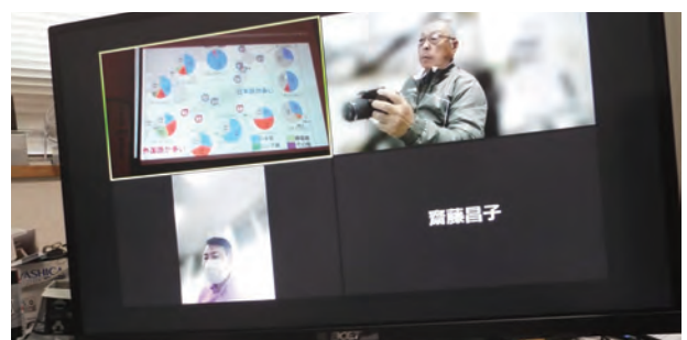
(誤字脱字がございましたらご容赦ください)