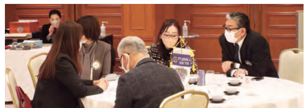
(誤字脱字がございましたらご容赦ください)