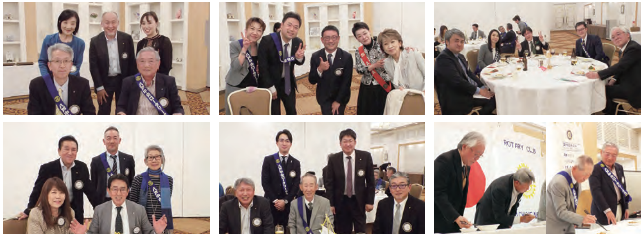
(誤字脱字がございましたらご容赦ください)